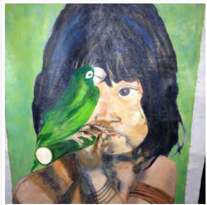
Obra de Maria J Fortuna